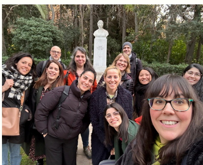
Priložnosti za učenje v Atenah

KEAN, partnerji iz Aten, ki so gostili drugo partnersko srečanje, so konzorciju predstavili primer, kako bi lahko turneja z zemljevidom HerStory izgledala v praksi.