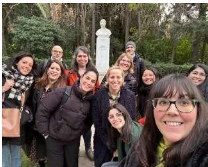
Ευκαιρία μάθησης στην Αθήνα

Το ΚΕΑΝ, οι συνεργάτες από την Αθήνα, που φιλοξενούν τη 2η διακρατική συνάντηση έργου, παρουσίασαν στην κοινοπραξία ένα παράδειγμα του πώς ο χάρτης ξενάγησης του HerStory θα μπορούσε να είναι στην πράξη.